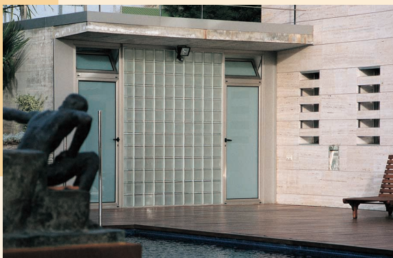
BlokUp Marco: Plata Weck Diseño: Spray