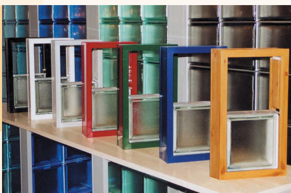
BlokUp Marco: Gama de colores Weck Diseño: Arctic