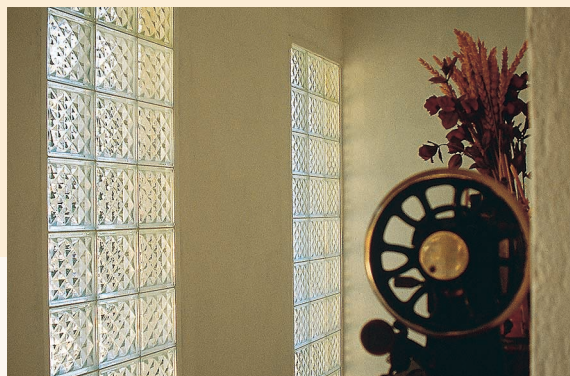
BlokUp Marco: Blanco Weck Diseño: Regent